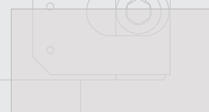
Tabla de medidas / Table of measurements

Medidas persiana (m. approx.) / Blind measures (m. approx.) Anchos hasta 3 metros / Widths up to 3 meters Otras medidas consultar / Other measures to consult